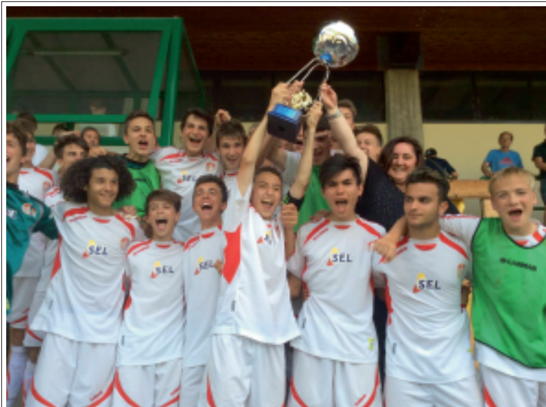
> La compagine del Suedtiroil, vincitrice della scorsa edizione

saranno disputate su campi in erba naturale ed in sintetico presso le strutture di Borgo Valsugana. Le formazioni che scenderanno in campo giocheranno un minimo di quattro incontri, tutte le squadre verranno premiate e ci saranno premi speciali alla squadra più corretta, al miglior portiere ed al miglior realizzatore; 28 le partite che saranno disputate tra il sabato pomeriggio e la domenica.