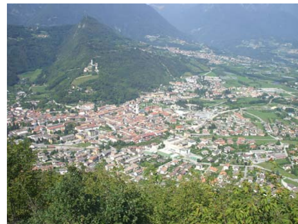
Veduta di Borgo Valsugana