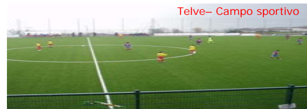
Telve– Campo sportivo