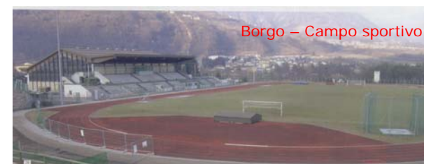
Borgo – Campo sportivo

Premi: Trofei e coppe a tutte le squadre partecipanti, T-shirts ricordo del Torneo a tutti gli atleti con medaglia ricordo.