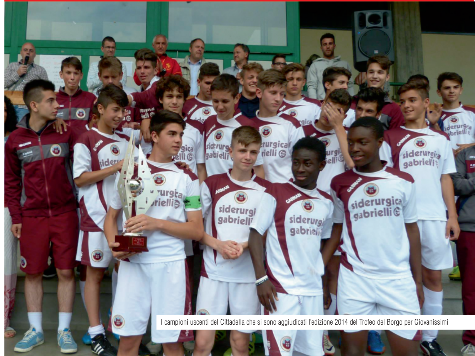
I campioni uscenti del Cittadella che si sono aggiudicati l'edizione 2014 del Trofeo del Borgo per Giovanissimi