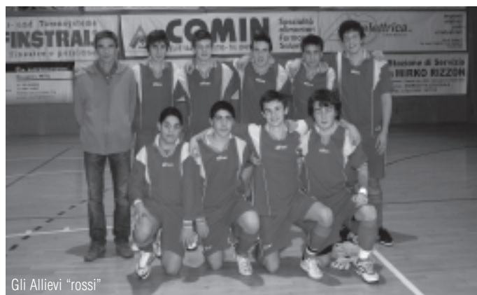
Gli Allievi "rossi"