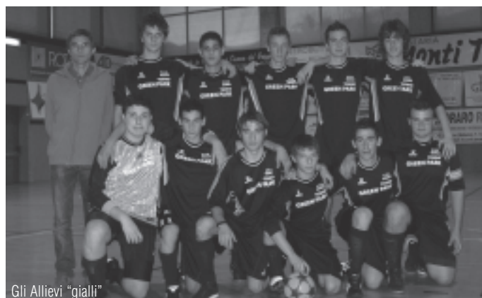
Gli Allievi "gialli"