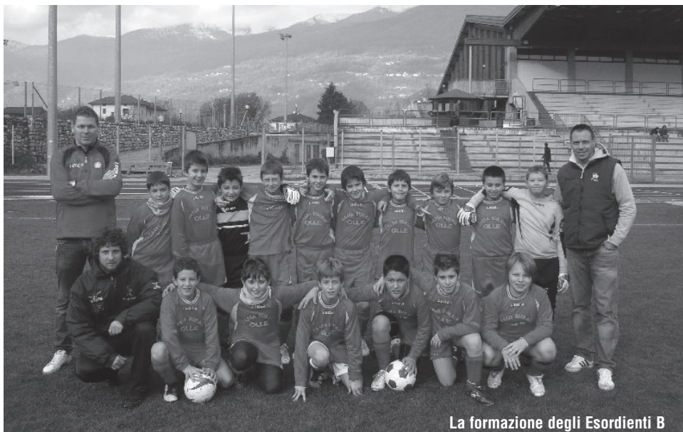
La formazione degli Esordienti B

formazione del "Gian" di misurarsi, alla ripresa del campionato, con le compagini più forti che si sono classificate ai primi posti in ognuno dei gironi trentini.