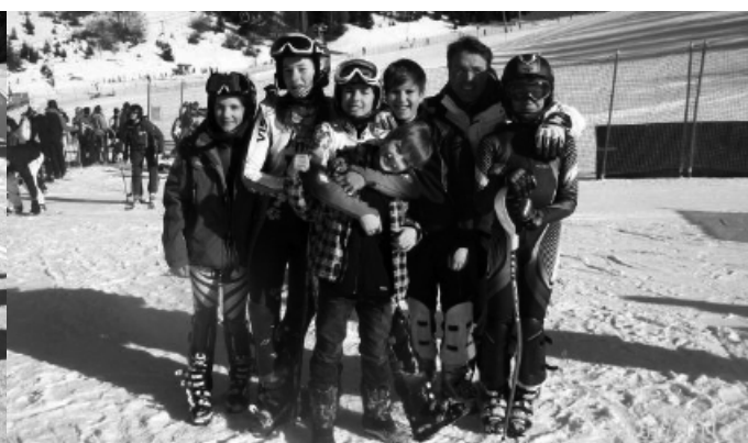
> Gli agonisti