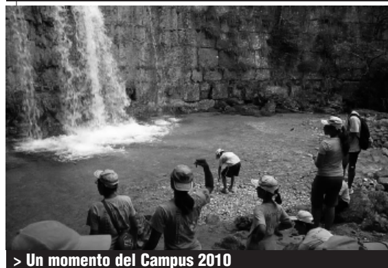
> Un momento del Campus 2010