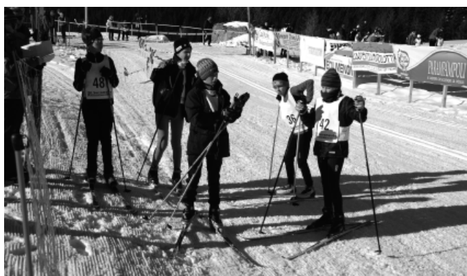
> I ragazzi del fondo