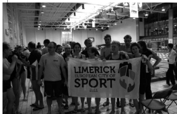
> Gli atleti Master RNV in Irlanda, 2011