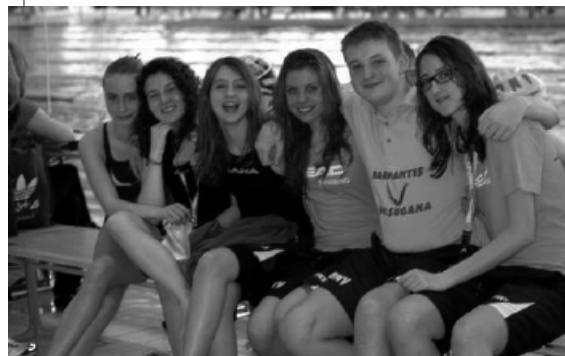
> Alcuni Assoluti a Monaco per il Meeting Internazionale Head Trophy 2011