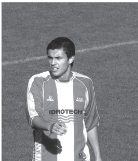
> El buitre Gonzo

Ora la colonna infame (quella di destra della classifica, tanto per capirci) è più lontana, e i chiari di luna di un settembre che ha mandato a vendemmiare quasi sempre gli avversari dei nostri sembra già in archivio, anzi, in cantina. Ovviamente l'errore che il gruppo potrebbe commettere ora è quello di ritenersi fuori dalle sabbie mobili, solo per il fatto di aver mostrato sul campo che certi valori non si perdono così banalmente per strada. La gioventù che condisce sempre di più la squadra dovrebbe invece garantire l'onda lunga dell'entusiasmo anche nelle prossime decisive gare: contro la Rotaliana, questa domenica, poi a Trento sul campo di un'Azzurra da prendere sempre con le molle, quindi in casa con la Bassa Anaunia prima dello sprint finale d'andata, tutto in apnea, a Romarollo contro la Baone, per chiudere in casa contro la capolista Calcio Chiese. Allora benvenuto dal Colosseo giallorosso a Floriani. 'Ave Cesare, pardon Ennio, e me raccomanno: facee vince '.