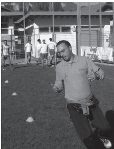
> Ave, Ennio. I tifosi chiedono sesterzi. "No, tiro dritto"