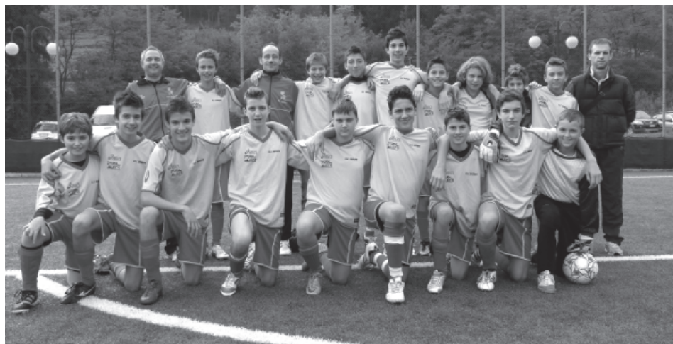
> La compagine dei Giovanissimi

Nel turno successivo, sul campo sintetico di