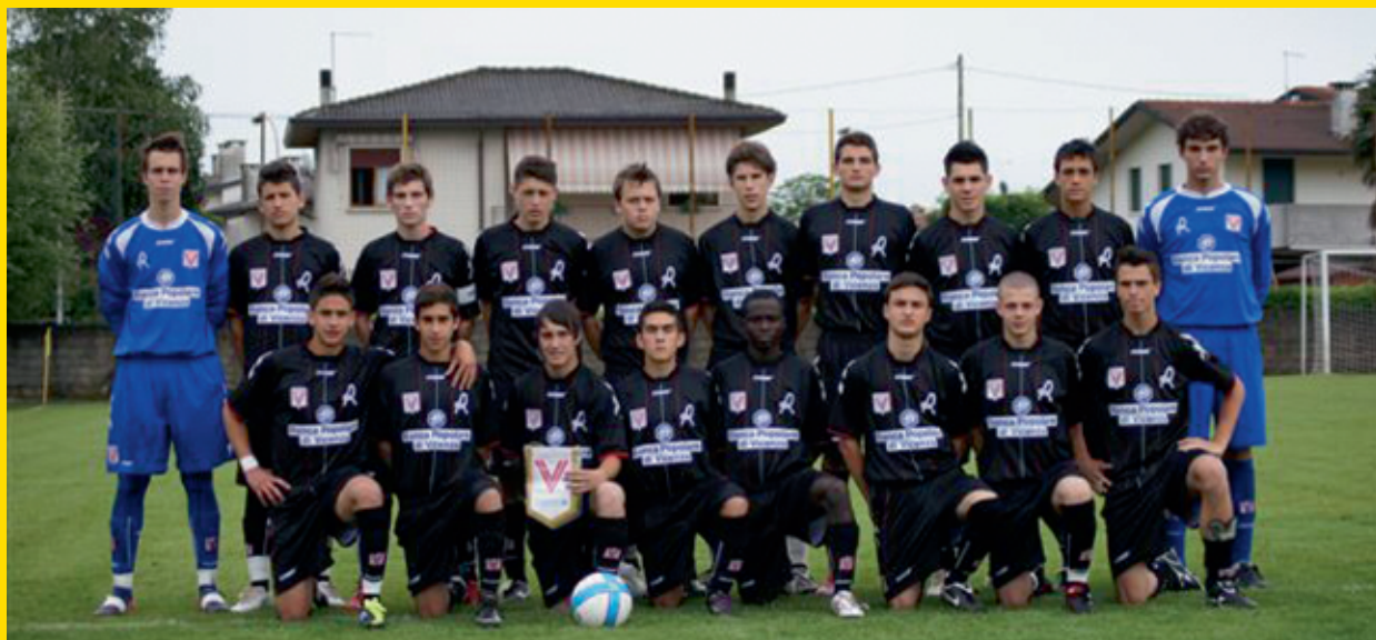
> Vicenza Calcio