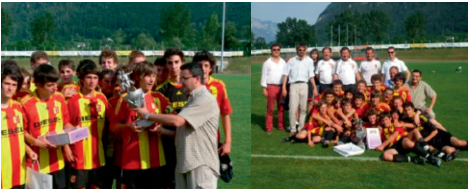
> 2009 - I Giovanissimi del Bassano Virtus che si sono imposti nella seconda edizione del "Trofeo del Borgo"

2010 (20 squadre partecipanti) Terza edizione: BASSANO VIRTUS (VI)