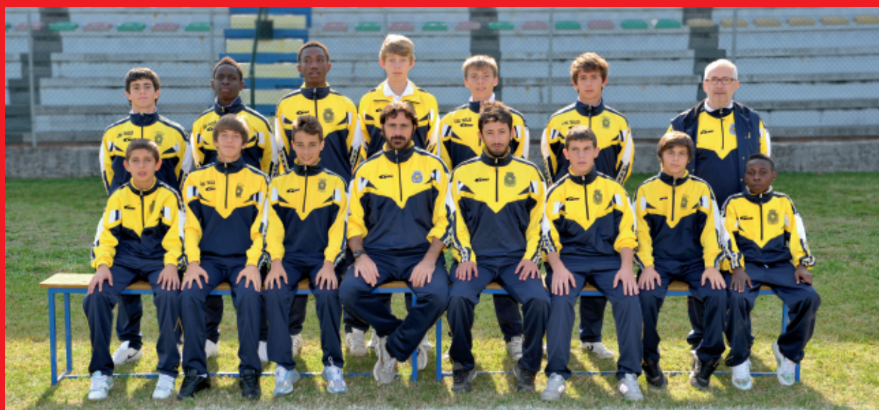
> A.S.D. Solierese (MO)