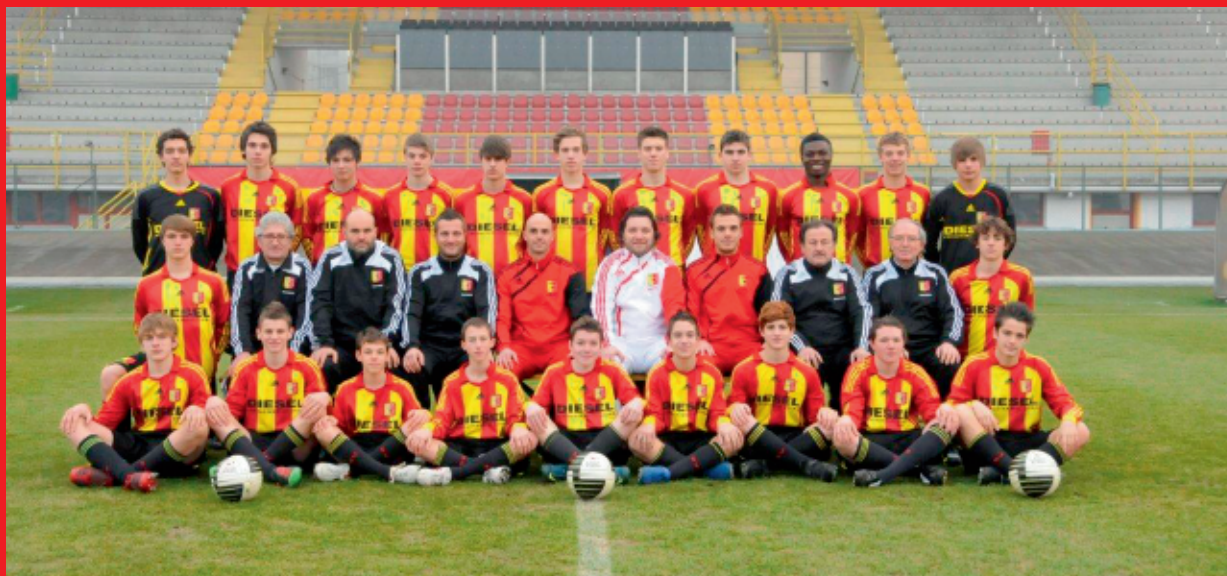
> U.S. Bassano Virtus (VI)