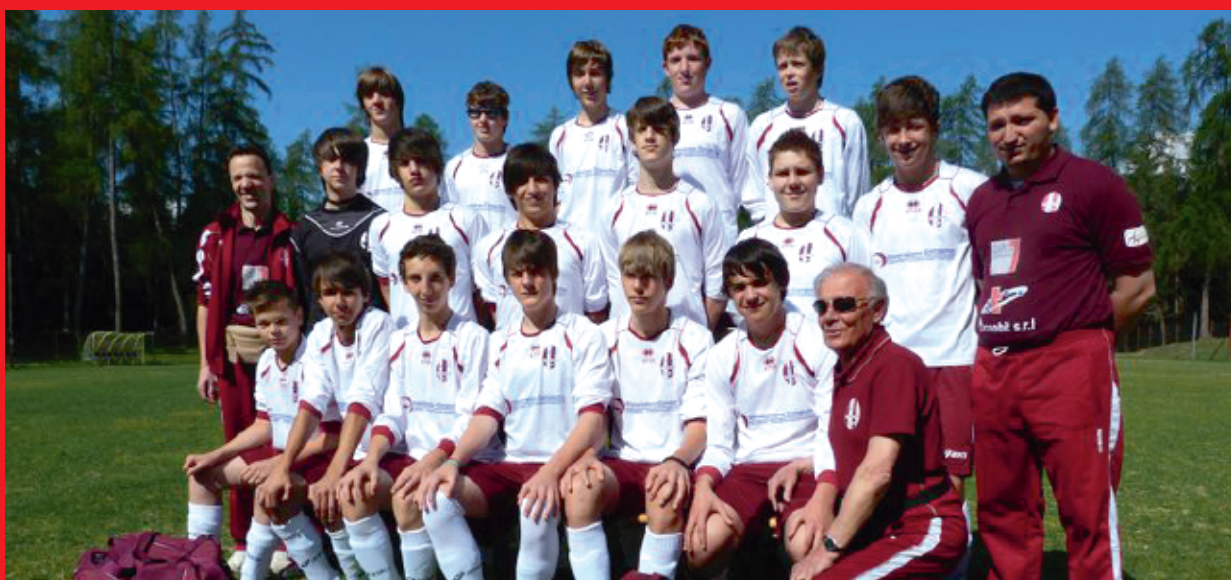
> A.C. Valle di Non