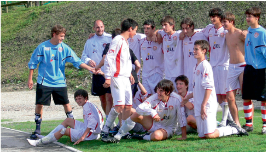
> 2008 - Il gruppo dei Giovanissimi del Südtirol-Alto Adige, vincitore della prima edizione del "Trofeo del Borgo" per Giovanissimi.

2009 (10 squadre partecipanti) Seconda edizione: BASSANO VIRTUS (VI)