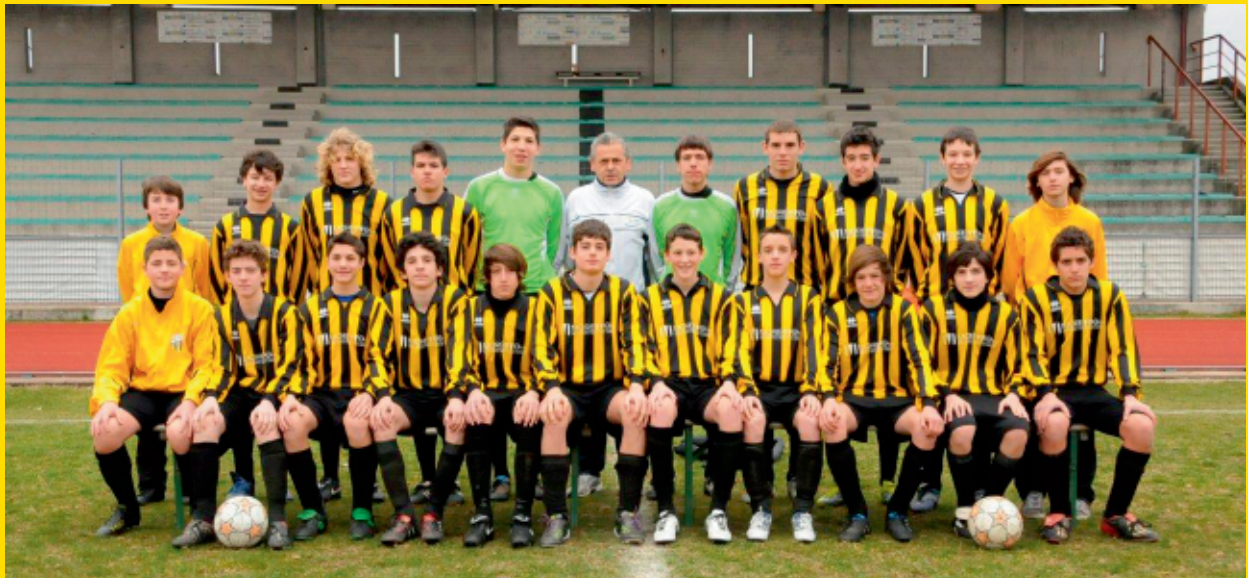
> Calcio Rosà (VI)