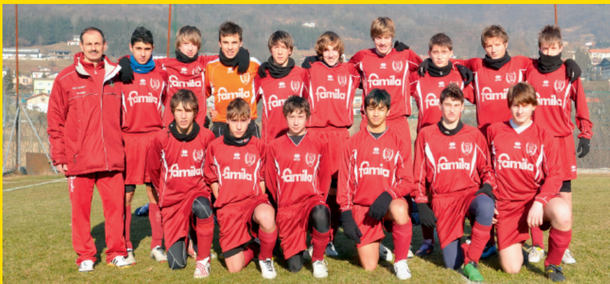
> U.S. Feltrese Calcio (BL)