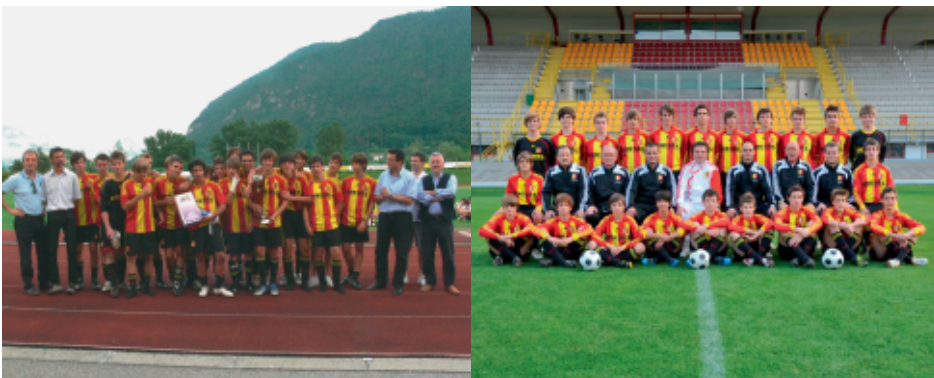
> 2010 - La formazione Giovanissimi del Bassano Virtus vincitrice dell'edizione 2010 del "Trofeo del Borgo"