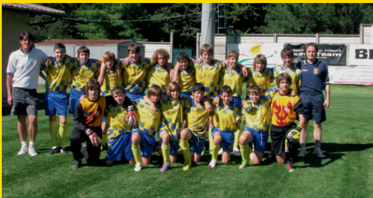
> U.S. Levico Terme