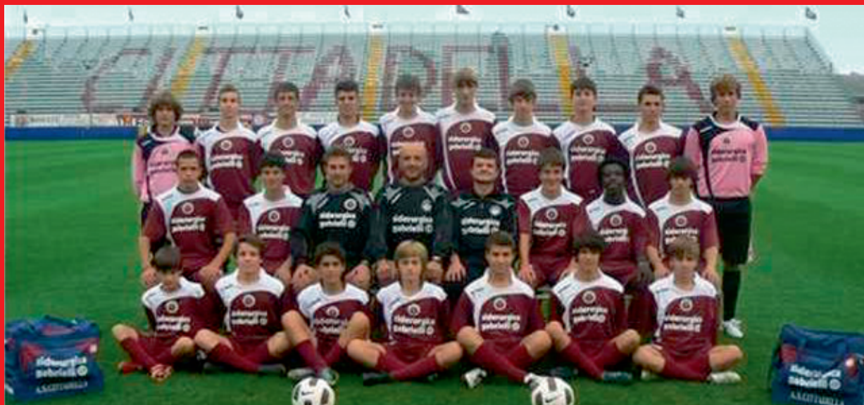
> A.S. Cittadella (PD)