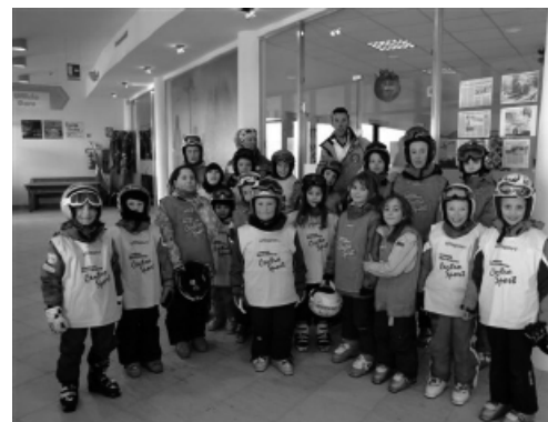
> I partecipanti in attesa del diploma

Sabato 19 febbraio si sono concluse le 6 lezioni di proseguimento del corso di sci di discesa. I partecipanti (più di 40!), supportati dai numerosi genitori e nonni presenti per l'occasione, si sono anche cimentati in una "gara" con partenza sotto il "muro" della pista "Bosco". Tutti, piccoli e anche i più "esperti", hanno affrontato le porte con grinta e concentrazione dimostrando un carattere da veri atleti!! Dopo una ulteriore sciata di "rilassamento" diploma di partecipazione a tutti assieme alla padellina e ad un simpatico gadget.