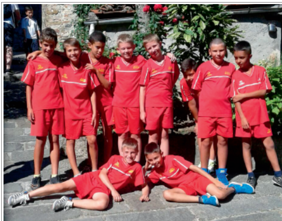
> I ragazzi in trasferta a Città di Castello