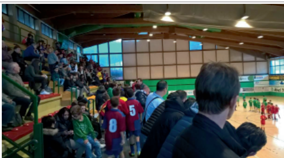
> Il pubblico presente al palazzetto