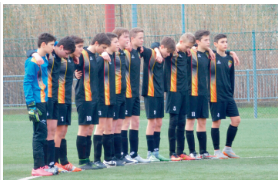
> I Giovanissimi Elite dell'US Borgo