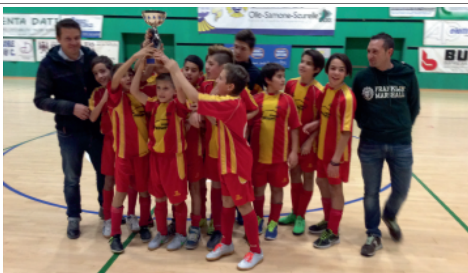
> La coppa: un vittoria di gruppo

BORGO A RONCEGNO A RONCEGNO B AUDACE FERSINA ORTIGARALEFRE LEVICO VALSUGANA BORGO B TELVE