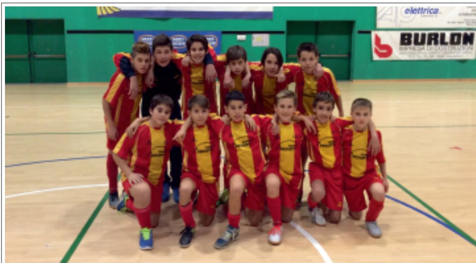
> La formazione del Borgo vincitrice del torneo

Giovedì 8 dicembre per iniziare i festeggiamenti del "Sessantesimo" di fondazione della nostra società è stato organizzato un torneo di Calcio a Cinque, chiamato per l'appunto TORNEO DEL 60° , ospitato dalla palestra del Palazzetto dello sport di Borgo Valsugana.