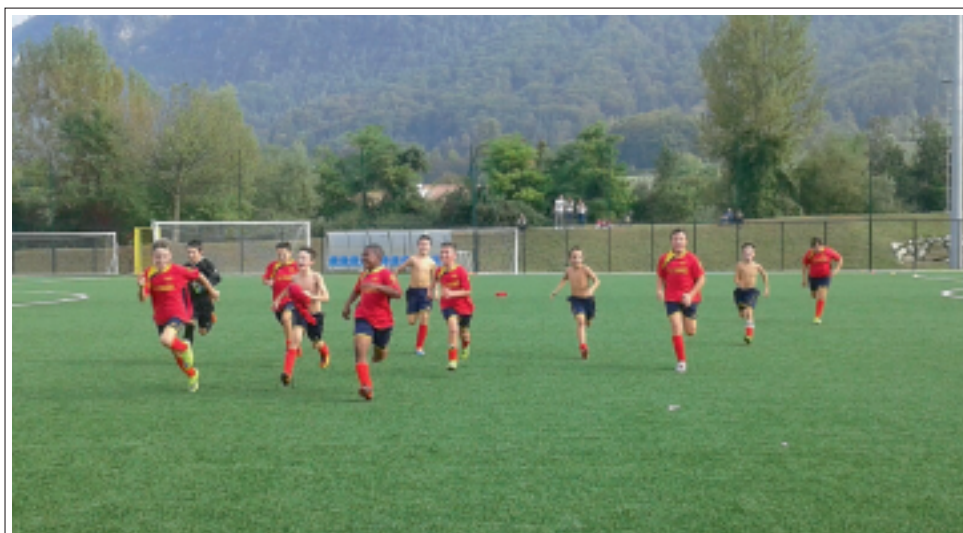
> Una corsa e ... via!