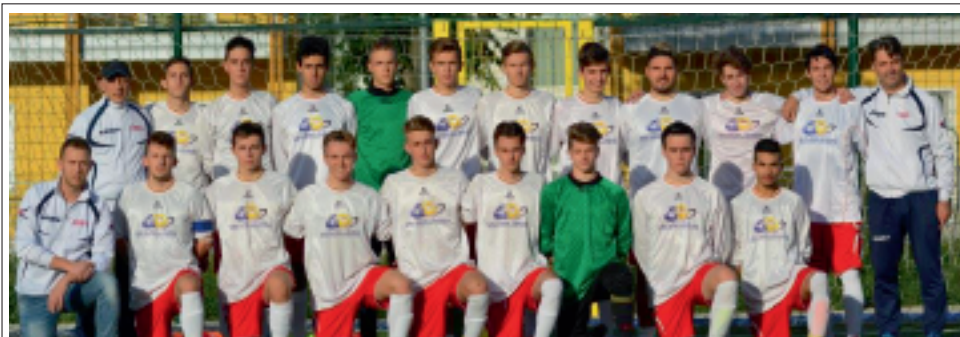
> La Squadra Juniores

Approfitto dell'occasione per augurare a tutti i lettori di Sport Giallorosso, buone feste.