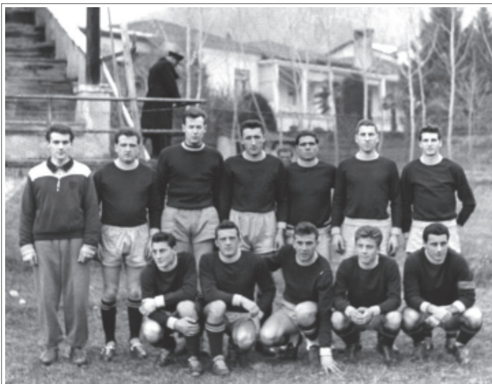
> Stagione agonistica 1956-57 nasce ufficialmente l'U.S. Borgo