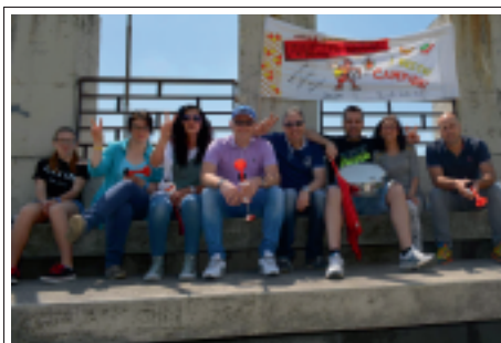
> Quelli della curva sud