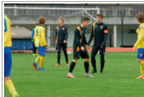
> Una fase di gioco nel campionato Allievi Provinciali