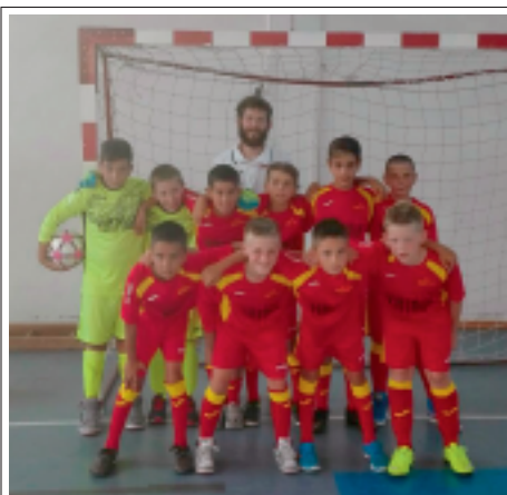
> Il gruppo in palestra