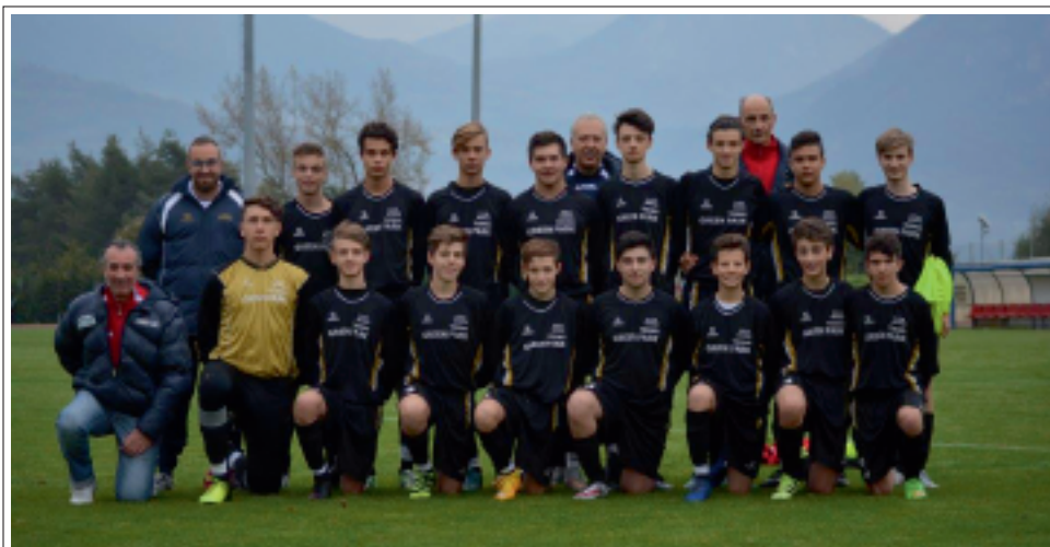
> La compagine degli Allievi Provinciali