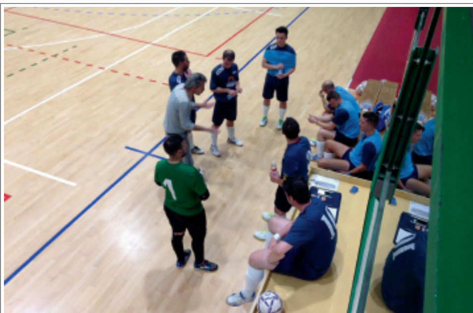
> Time out per quelli del futsal giallorosso