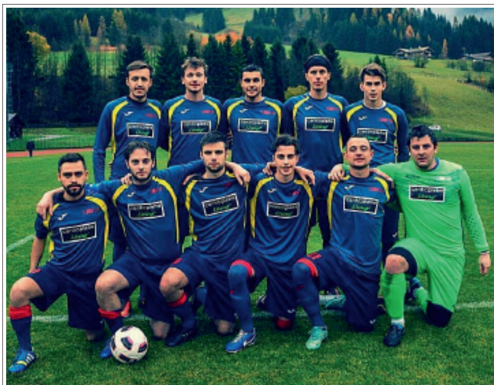
> La formazione che partecipa al campionato di Prima Categoria