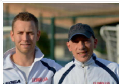
> I due mister

Come dicevo prima, la squadra è compatta e solida in ogni reparto, sa giocare a calcio e riesce spesso a sfoderare delle belle prestazioni. Unica pecca è che ogni tanto bisognerebbe chiudere prima le partite anziché giocare molto nella metà campo avversaria facendo i leziosi, senza avere quel po' di cinismo che ti permette di voler mettere subito l'incontro dalla tua.