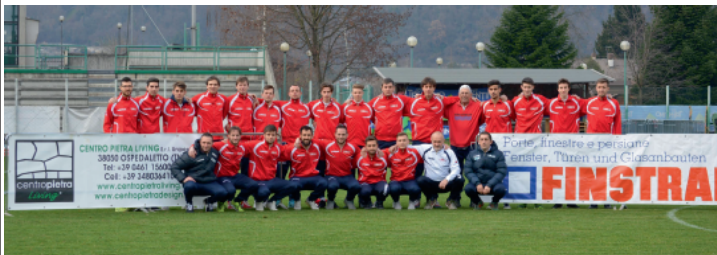
> L'organico della prima squadra dell'US Borgo che partecipa con successo al campionato di Prima Categoria provinciale

rimediate negli scontri diretti con Gardolo e Fiemme, entrambe di misura e con i ragazzi di Libanoro che per lunghi tratti si sono fatti preferire agli avversari. Inaspettato, invece, lo scivolone alla quinta giornata in casa del Verla per 3 a 1, sconfitta maturata nell'ultimo quarto d'ora. Il pareggio con la Dolomitica alla nona è fino a qui l'unica "X" di questo girone di andata. Le ultime tre partite hanno