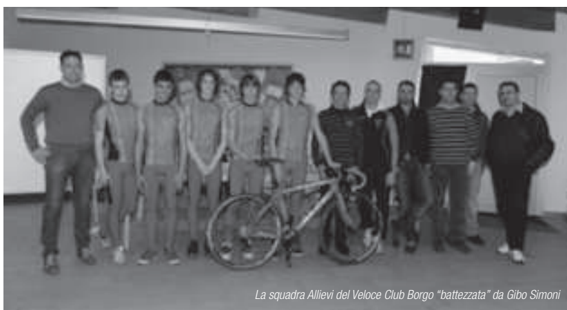
La squadra Allievi del Veloce Club Borgo "battezzata" da Gibo Simoni