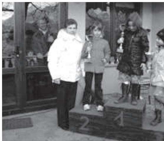
Supert baby femminile