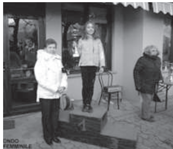
Fondo baby sprint femminile