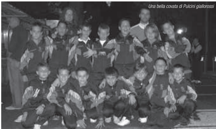
Una bella covata di Pulcini giallorossi