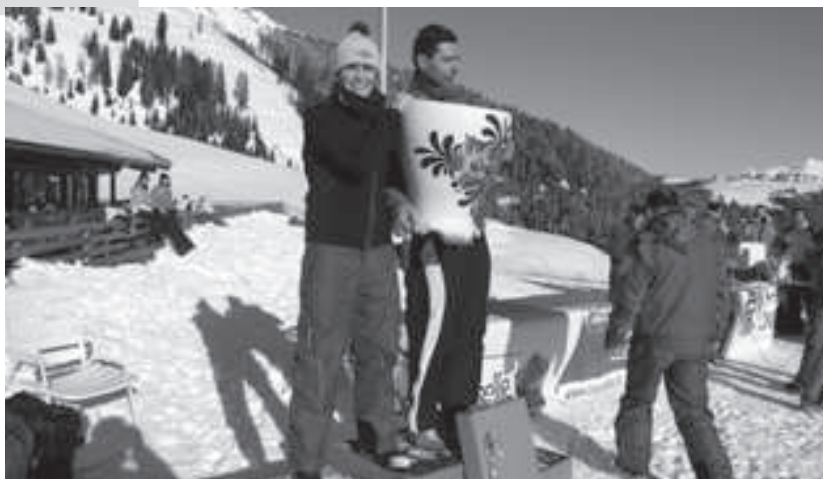
I due migliori tempi