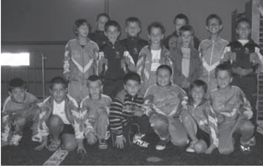
Foto di gruppo per i Pulcini B e C