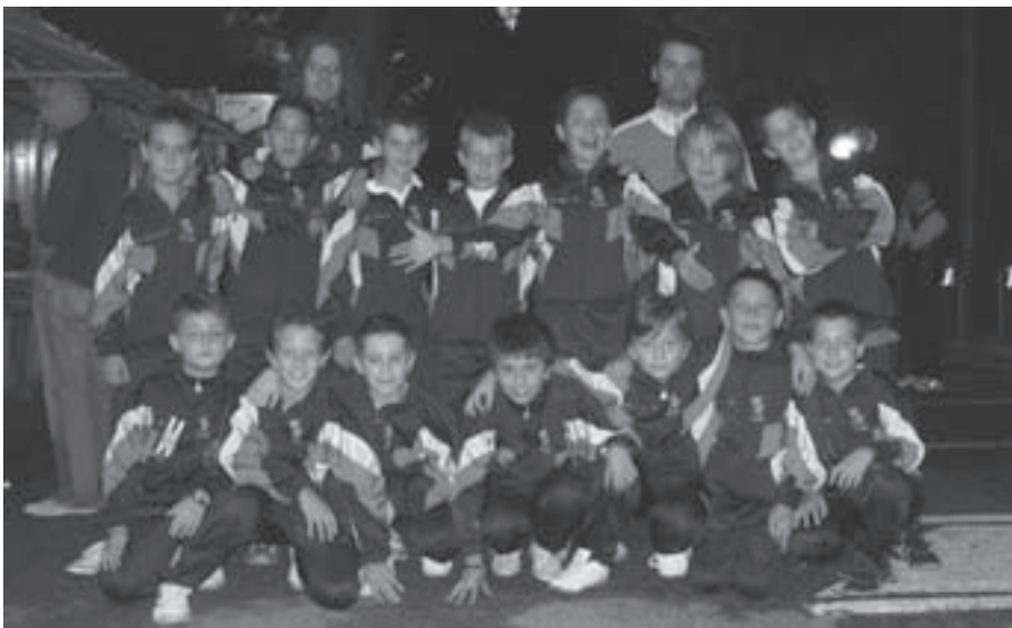
La squadra giallorossa dei Pulcini A