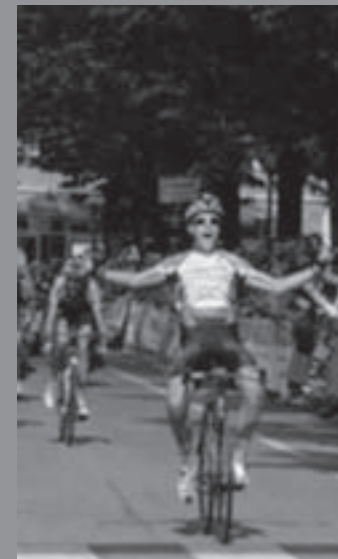
Lo sprint vincente di Alberto Bettiol, il tredicesimo toscano ad aggiudicarsi la Coppa d'Oro > pag. 14