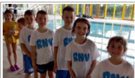
> Gara propaganda 11 aprile 2015 Esordienti C e Allievi