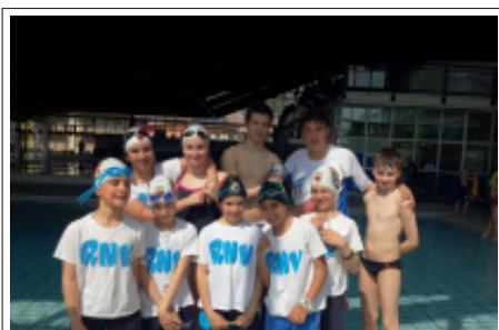
> Gara propaganda 11 aprile 2015: Amatori