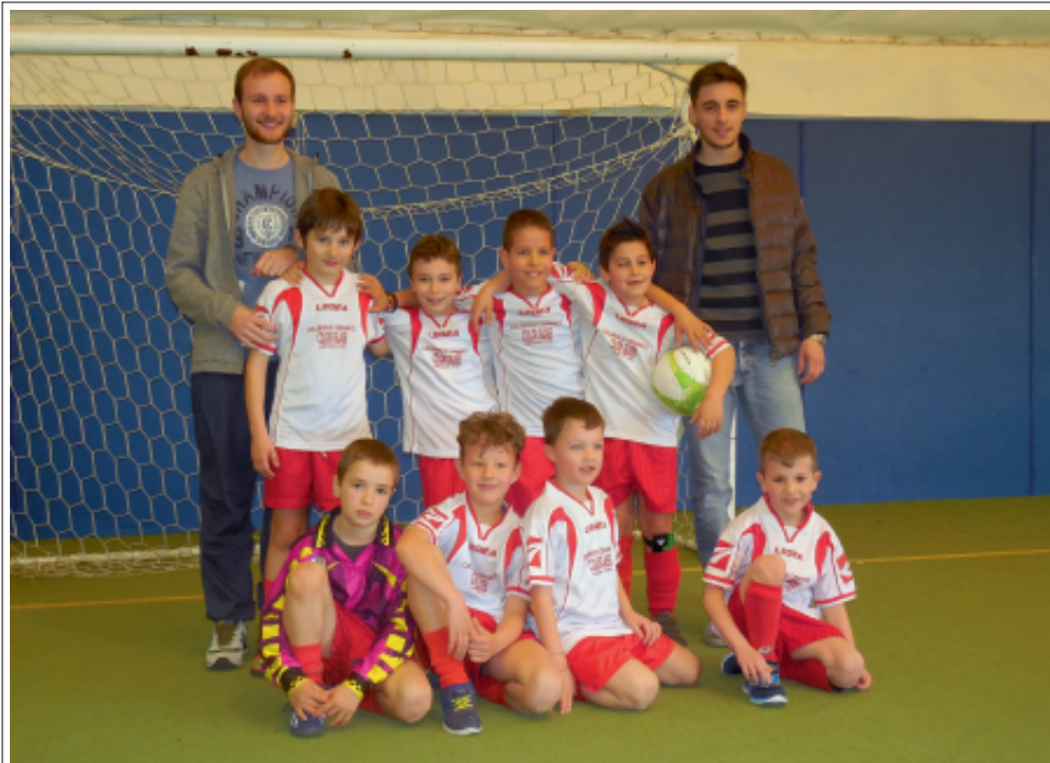
> La formazione dei Piccoli Amici

Continua positivamente la stagione dei Piccoli Amici, che visti i numeri non ha nulla da invidiare alle squadre maggiori. Sono 20 infatti i ragazzi che i pomeriggi del lunedì e mercoledì si ritrovano al campo per l'allenamento. Dal 29 marzo, per circa un mese, i ragazzi del 2007 partecipano al torneo "tutti in campo" organizzato dalla polisportiva Oltrefresina presso il campo sportivo di Madrano. Essendo ancora piccoli il risultato non conta, l'importante è divertirsi tutti assieme, aguriamo perciò buona fortuna ai Piccoli Amici.