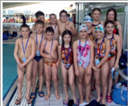
> Gara di qualificazione esordienti A e B di domenica 12 aprile 2015 a Rovereto