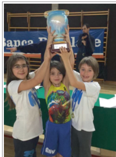
> La bambine della Rari Nantes Valsugana alzano con orgoglio la coppa conquistata grazie al secondo posto ottenuto al 5° Meeting interregionale "Trofeo San Nicolò" organizzato a Levico Terme il 7 dicembre dello scorso anno. La vittoria nella prestigiosa manifestazione messa in cantiere dalla RNV è andata alla società Gymnasium Pordenone, ma le nostre rari-nantine si sono lasciate alle spalle sodalizi di buona caratura a livello provinciale come il Chiese nuoto, terzo classificato, e il Latemar Nuoto giunto quarto nella classifica per società.