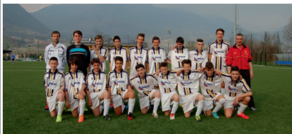
> Le formazioni dei Giovanissimi giallorossi