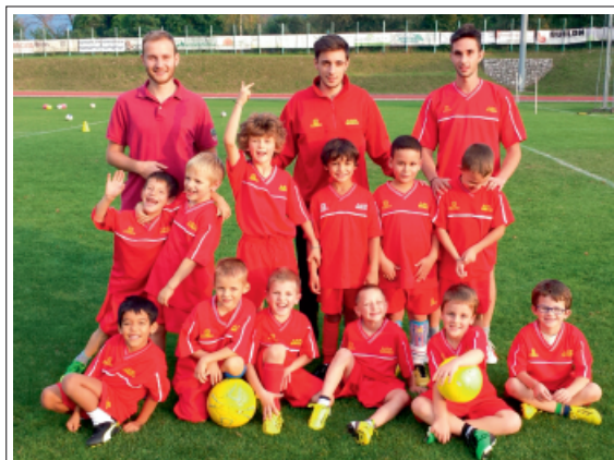
> Il gruppo dei Piccoli Amici 2014-2015