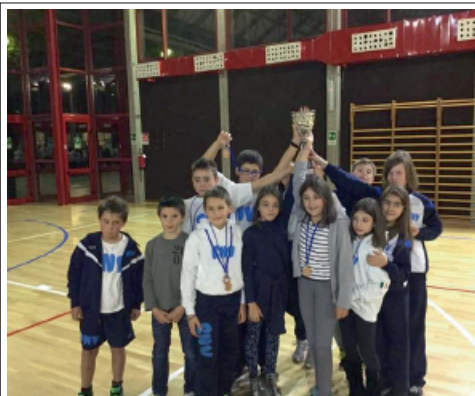
> RNV vince il 1° Meeting Esordienti Città di Levico Terme