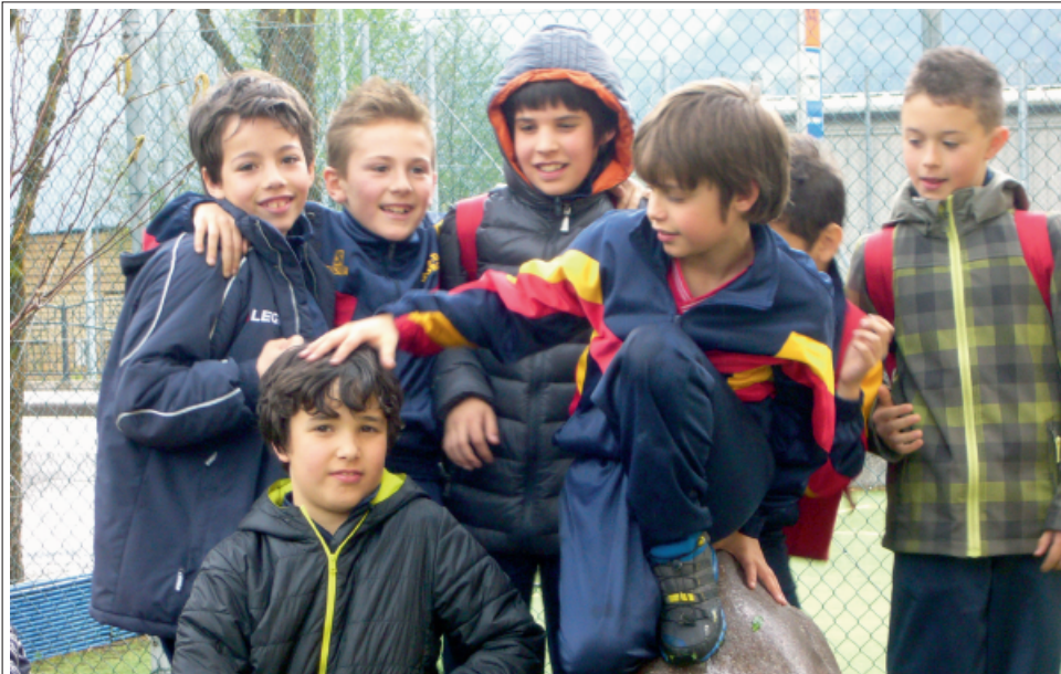
> Il gruppo dei Pulcini A 2014-2015