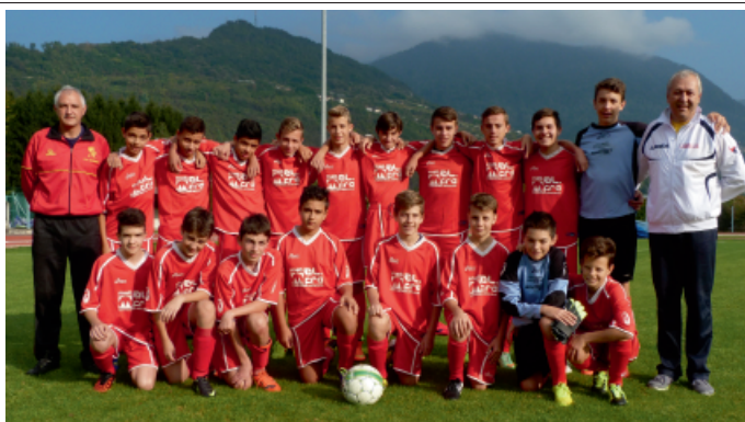
> Il team regionale Giovanissimi 2014-2015

con una serie di risultati positivi in entrambe le formazioni. Tre sono ora gli allenamenti settimanali dove, dopo un momento iniziale per tutti uguale, i ragazzi vengono divisi in due gruppi omogenei, in base al livello di apprendimento, per permettere che tutti gli esercizi previsti siano svolti nel modo migliore. L'approccio al girone di qualificazione dei giovanissimi elite è stato davvero positivo visto che hanno vinto tutte le 8 partite, quindi 24 punti fatti, 33 reti siglate e 5 subite,