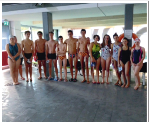
> La squadra Ragazzi, Junior, Cadetti Senior

La stagione sportiva 2014-2015 è iniziata il 10 settembre 2014 con gli allenamenti presso la piscina comunale di Levico Terme.