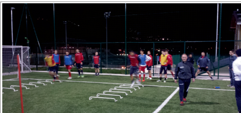
> La squadra di Promozione in allenamento