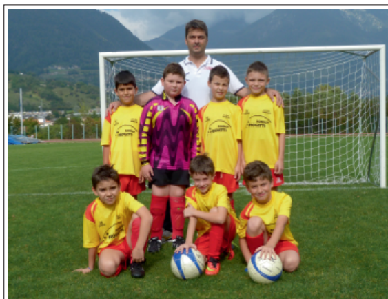
> La formazione Pulcini C 2014-2015