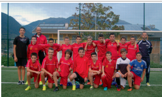
> Il team provinciale Giovanissimi 2014-2015