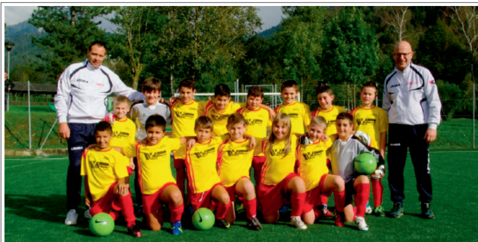
> Il gruppo dei Pulcini B 2014-2015