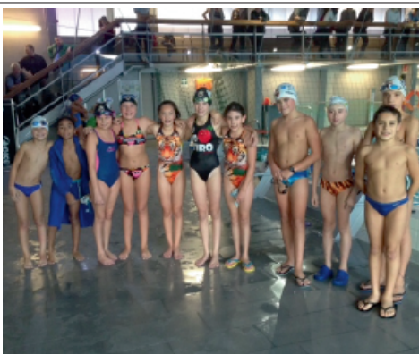
> La squadra Esordienti