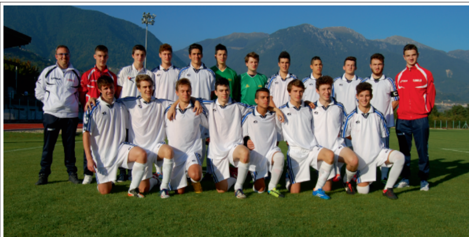
> La formazione Juniores 2014-2015