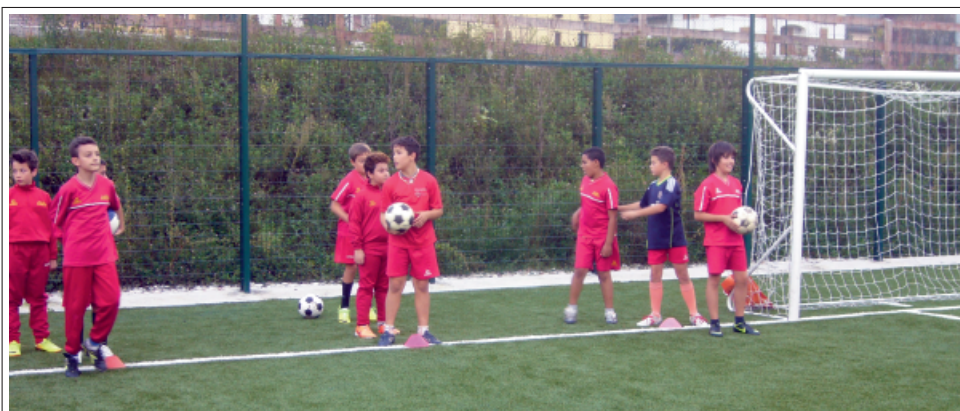
> Una fase di allenamento