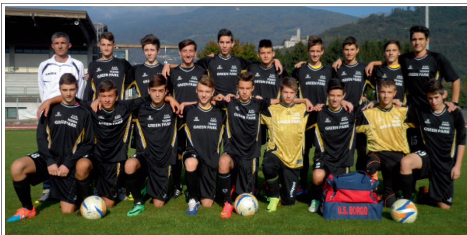
> La formazione Allievi 2014-2015