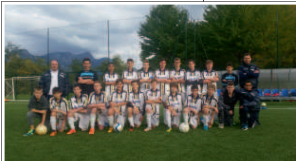
> La squadra Giovanissimi Provinciali

Trentanove ragazzi per due compagini; ecco il format dei Giovanissimi