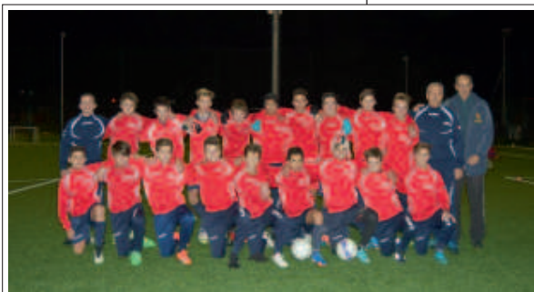
> La squadra Giovanissimi Regionali

Borgo Valsugana - Piazza Martiri, 11 tel. e fax 0461 754042