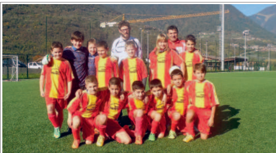
> La squadra Pulcini A