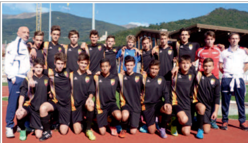
> La formazione Allievi dell'US Borgo

che più si urla e più si caricano i giocatori, può succedere anche l'inverso!