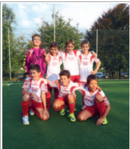
> La squadra Pulcini C

Piné, Roncegno, Levico A e B, Ischia, Oltrefersina e Valsugana. Concludiamo augurando in bocca al lupo a questi piccoli calciatori!