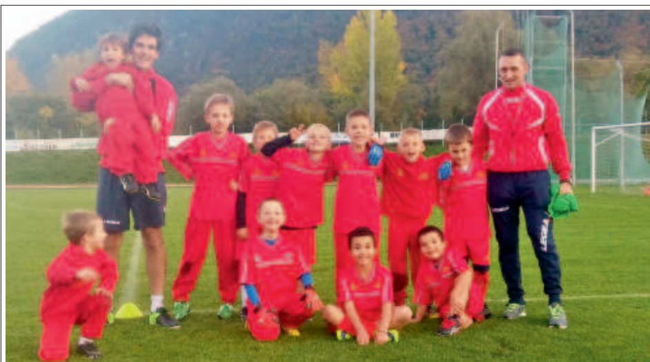
> La squadra Primi Calci