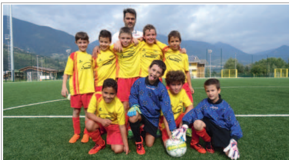
> La squadra Pulcini B

Piazzale Dante Alighieri, 3 Borgo Valsugana TN tel. 0461 753177