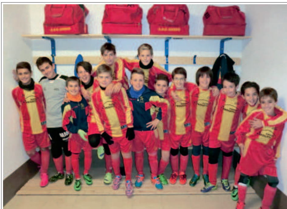
> Il gruppo dei Esordienti, classi 2003 e 2004