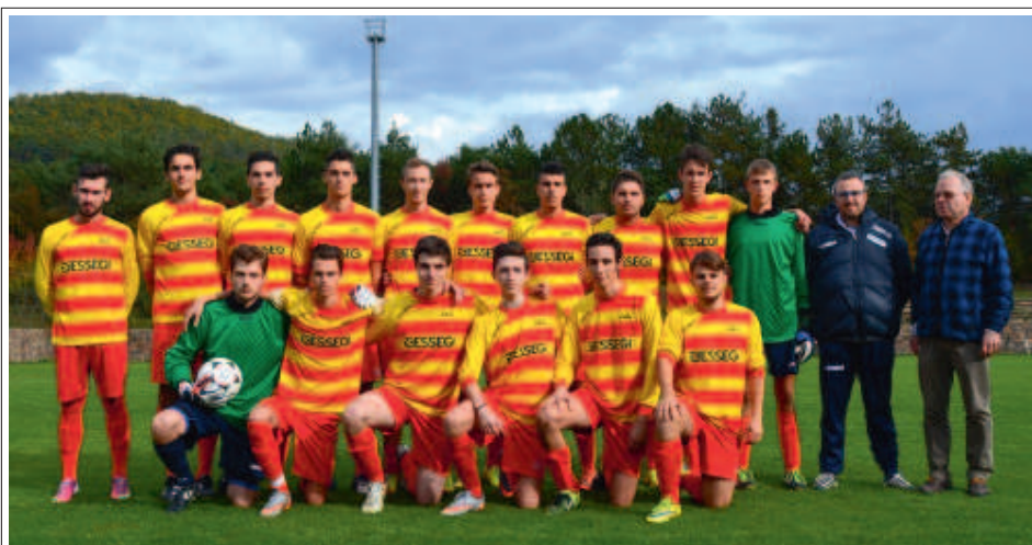
> La squadra Juniores giallorossa