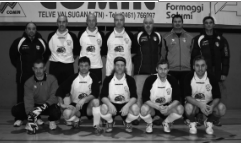
Sopra: Borgo e Villazano, protagonisti della finale Over 35; i baby più bravi: gli Esordienti del Povo; a fianco: gli Amici Calcio Borgo che hanno messo in fila le altre "vecchie Glorie".