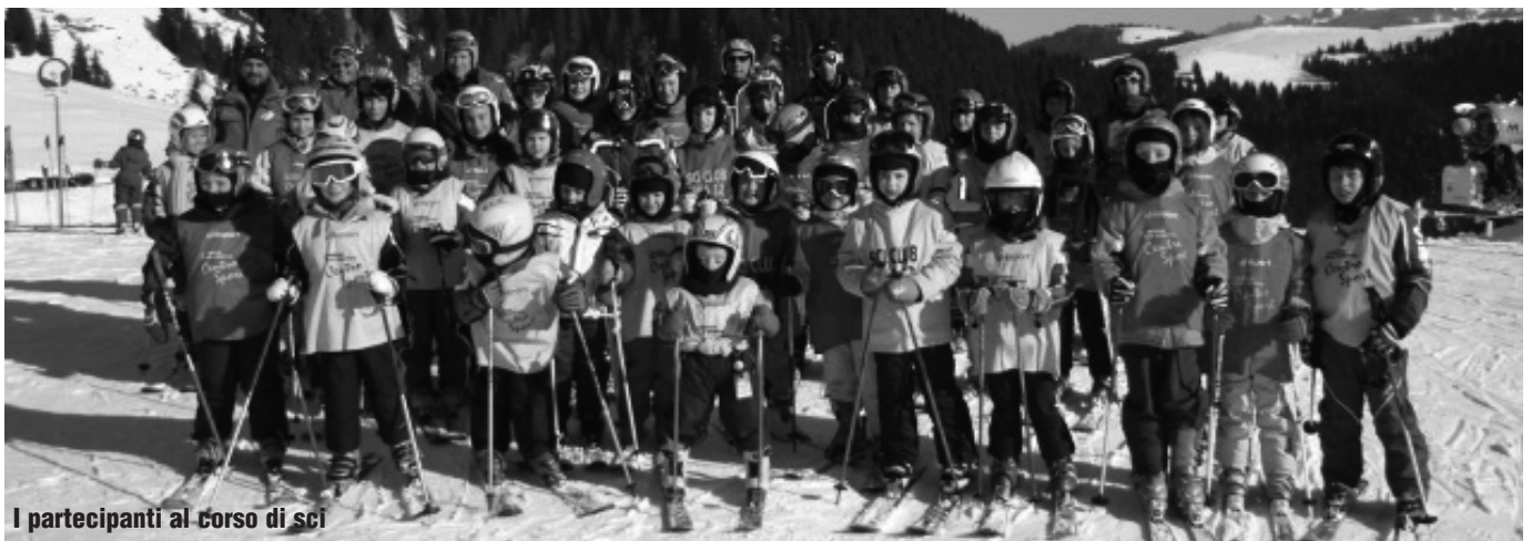
I partecipanti al corso di sci

Da queste pagine vogliamo invece mandare